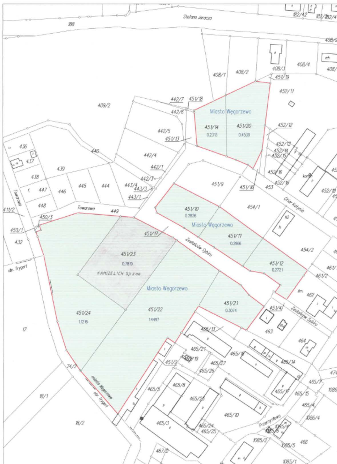
Podstrefa: Węgorzewo Obręb ewidencyjny: nr 1 m. Węgorzewo Skala 1:1000

Warmińsko - Mazurska Specjalna Strefa Ekonomiczna Warmia – Mazury Special Economic Zone ul. Barczewskiego 1, 10-061 Olsztyn tel/fax. +48 89 535 02 41 www.wmsse.com.pl